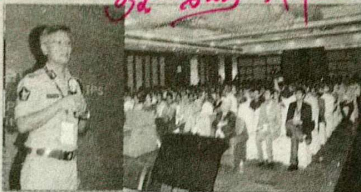
సిమినార్లో పాల్గొన్న యువత (ఇన్సెట్లో మాట్లాడుతున్న సిపి)